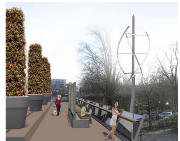
3D computer tekening van de wandel promenade met de Synthetic Cone boompotten, Big Art Benches, Facet hekwerk en aerodynamische windmolen.

De variatie in materiaal en kleur creëert een feestelijk lint met een eigentijdse touch. Door diverse gaassoorten te combineren wordt de mate van transparantie gevarieerd. De blauw accenten in het hekwerk corresponderen met de blauwe lichten van het totaal lichtplan.