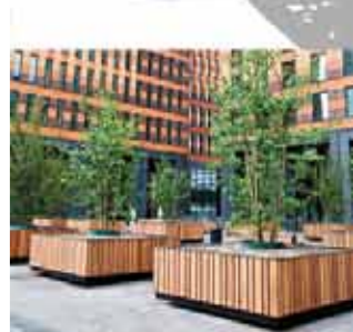
Zuid As Amsterdam