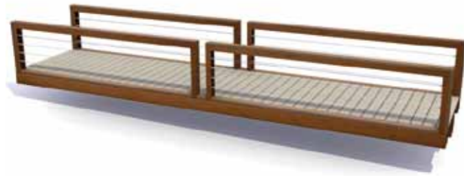
CorTen balustrades met RVS kabels

Streetlife ontwerpt en realiseert architectonische bruggen. De Crossline Bruggen van Streetlife creëren een warm en uniek beeld door de CorTen balustrades en het sustainable dek van composiet hout.